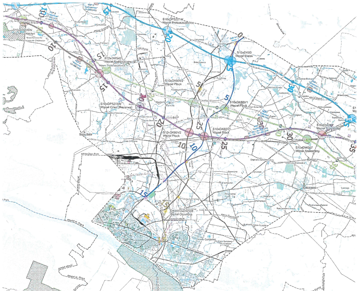
Rysunek 2 Warianty przebiegu drogi ekspresowej S10 i drogi krajowej nr 60

W związku z opracowywaniem dokumentacji projektowej budowy drogi ekspresowej S10 i S50 A1 - Obwodnica Aglomeracji Warszawskiej GDDKiA O. Bydgoszcz poinformowała 1 , że Wykonawca, tj. konsorcjum projektowe: TPF Sp. z o.o. (lider konsorcjum) i Databout Sp. z o.o. (partner) opracowali Studium Techniczno – Ekonomiczno – Środowiskowe, które zostało przyjęte na posiedzeniu Zespołu Oceny Przedsięwzięć Inwestycyjnych (ZOPI) w dniu 22.09.2025 roku, również przy udziale zaproszonych gości, w szczególności Pana Prezydenta Artura Zielińskiego. Aktualnie wprowadzane są uwagi do dokumentacji po posiedzeniu oraz trwa wewnętrzna procedura uzgadniania dokumentacji w GDDKiA zmierzająca do przeprowadzenia na przełomie roku 2025/2026 posiedzenia Komisji Oceny Przedsięwzięć Inwestycyjnych przy Generalnym Dyrektorzem Dróg Krajowych i Autostrad w Warszawie. Efektem prac będzie zatwierdzenie dokumentacji i wskazanie wariantu preferowanego do wniosku o wydanie decyzji o środowiskowych uwarunkowaniach dla przedsięwzięcia pn.: „Budowa drogi ekspresowej S10 na odc. od granicy województwa do DK50 i S50 na odc. od DK50 do S7”.