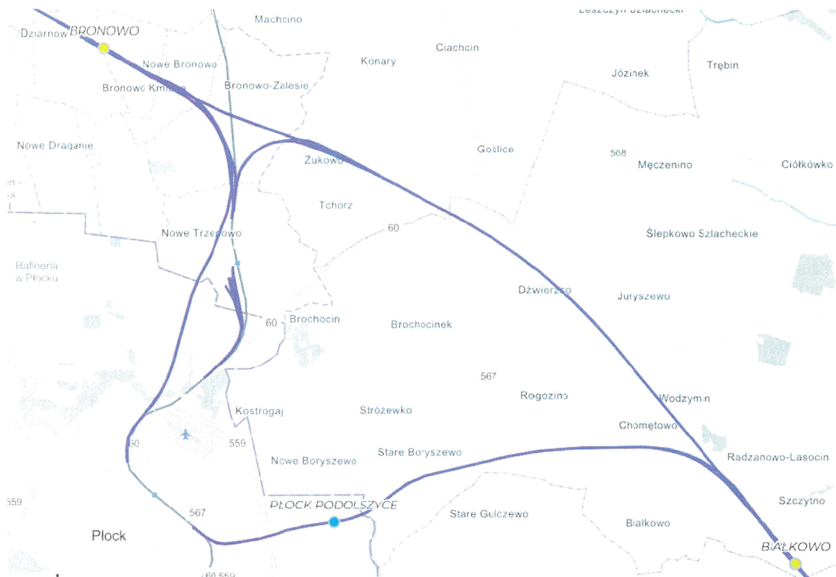
Rysunek 3 Planowany przebieg torów dla obsługi Miasta Płock - wariant W41.

Linia będzie miała charakter mieszany, co umożliwi zarówno ruch pasażerski jak i towarowy. Przewidziano jej wykorzystanie jako nowoczesnego korytarza dla pociągów intermodalnych, zwłaszcza w kierunku portów Trójmiasta oraz do obsługi kluczowych centrów przemysłowych, w tym rafinerii w Płocku. Trasa zostanie zelektryfikowana prądem przemiennym o napięciu 2 \times 25 kV, co odpowiada standardom obowiązującym w nowoczesnych europejskich sieciach KDP.