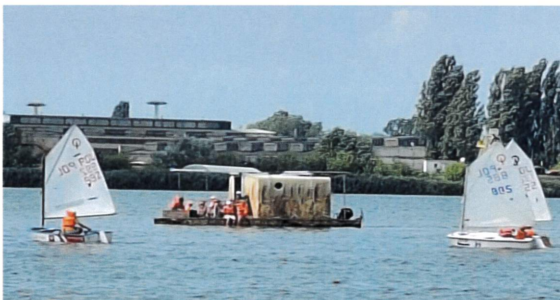
„ houseboat” wykorzystywany jako jednostka zabezpieczenia ratowniczego.