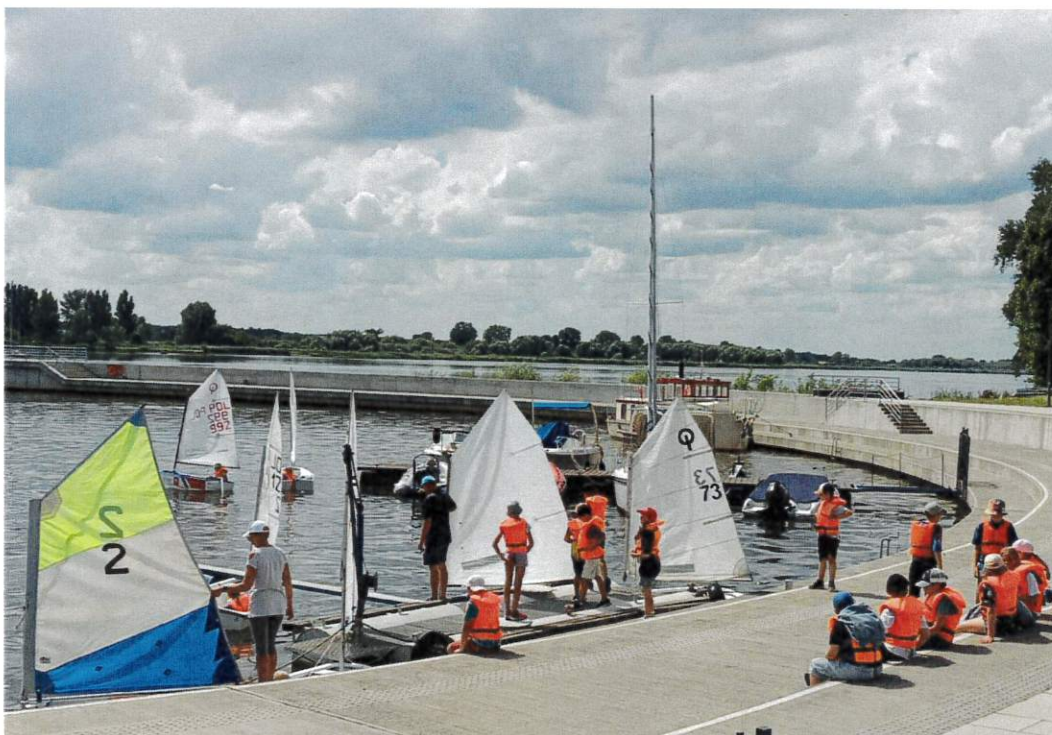
Dzieci korzystające z „Dźwignę pływającą”, jako przystani wodnej

Bo bezpieczeństwo dzieci jest najważniejsze.