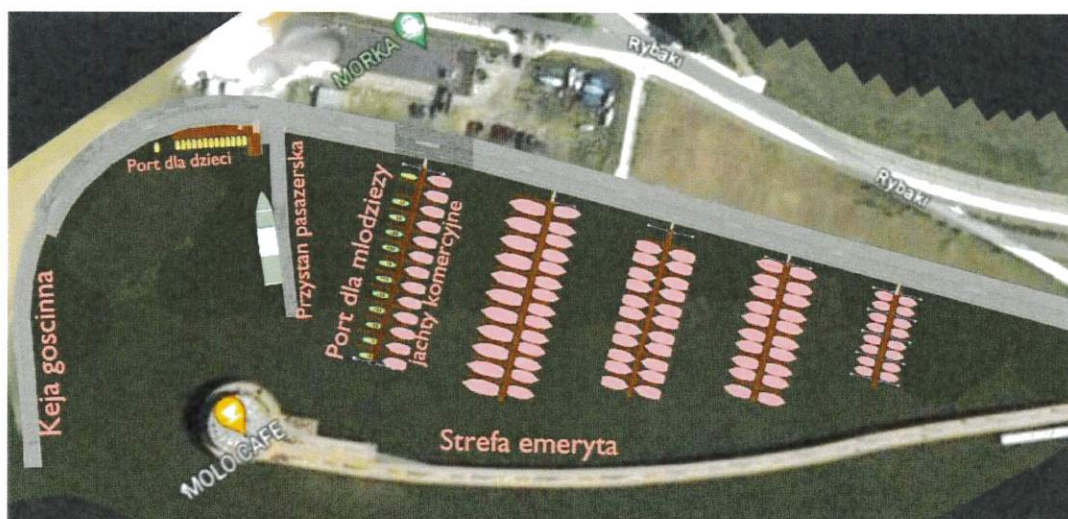
Proponowane położenie „Dziecięcego Portu Jachtowego”