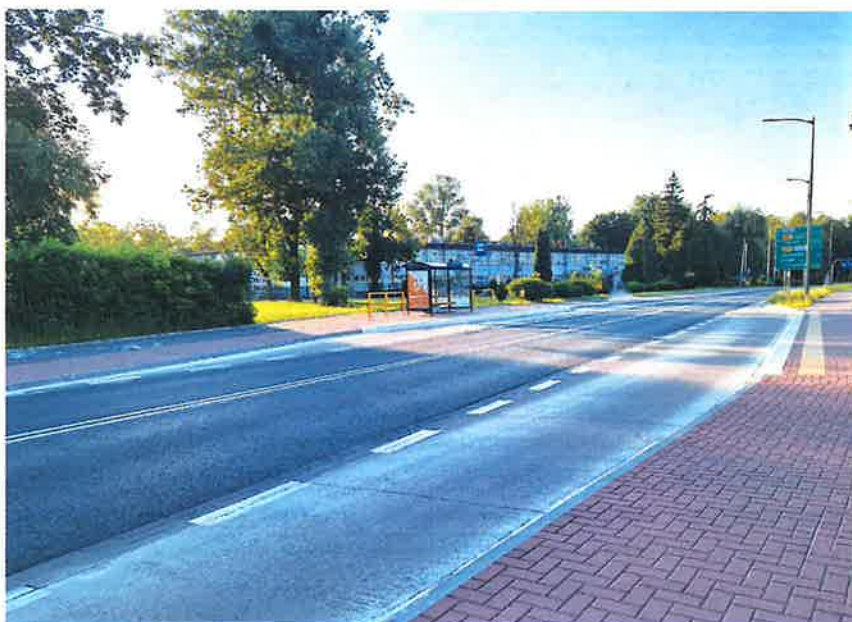
ul. Ignacego Łukasiewicza

Przebudowa ul. Łukasiewicza od al. Kobylińskiego do ul. Nowowiejskiego wraz ze ścieżką w ul. Nowowiejskiego w ramach V etapu przebudowy od ul. Nowowiejskiego do ul. Tysiąclecia. Na podstawie umowy zawartej w dniu 24 maja 2022 roku przebudowano drogę na długości 537 m w zakresie wykonania nowej jezdni asfaltowej, chodników z kostki betonowej oraz asfaltowej drogi rowerowej. Wartość inwestycji: 14.858.502,85 zł. Realizacja inwestycji odbyła się z dofinansowaniem w kwocie 5.400.000 zł z Rządowego Funduszu Polski Ład: Program Inwestycji Strategicznych oraz w kwocie 648.000 zł z budżetu Województwa Mazowieckiego w ramach „Instrumentu wsparcia zadań ważnych dla równomiernego rozwoju województwa mazowieckiego” i w kwocie 81.000 zł z sposobu finansowania „IH” środki z opłat i kar ochrony środowiska.