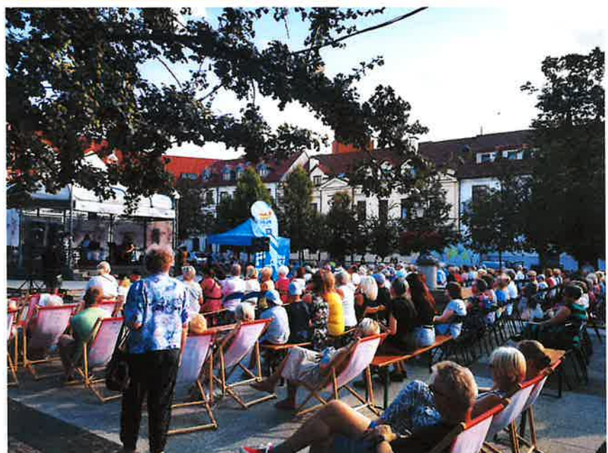
Muzyczne czwartki na płockiej starówce