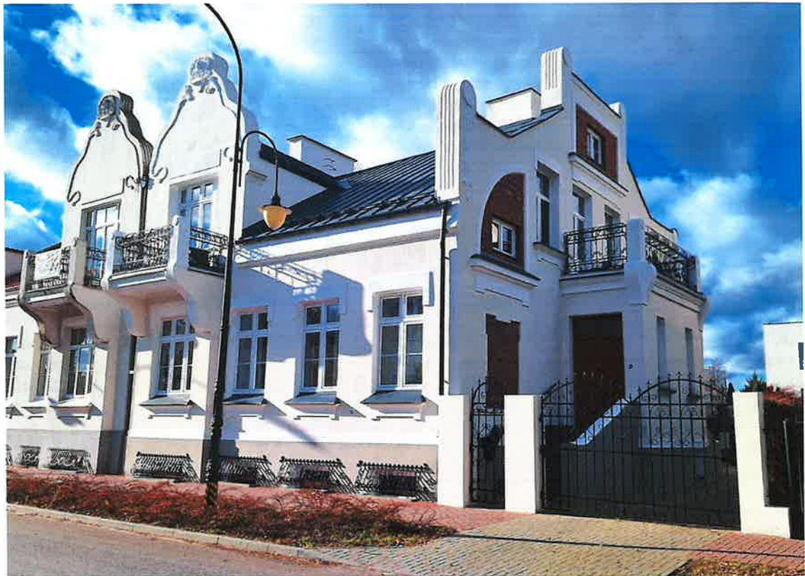
ul. Piękna 3