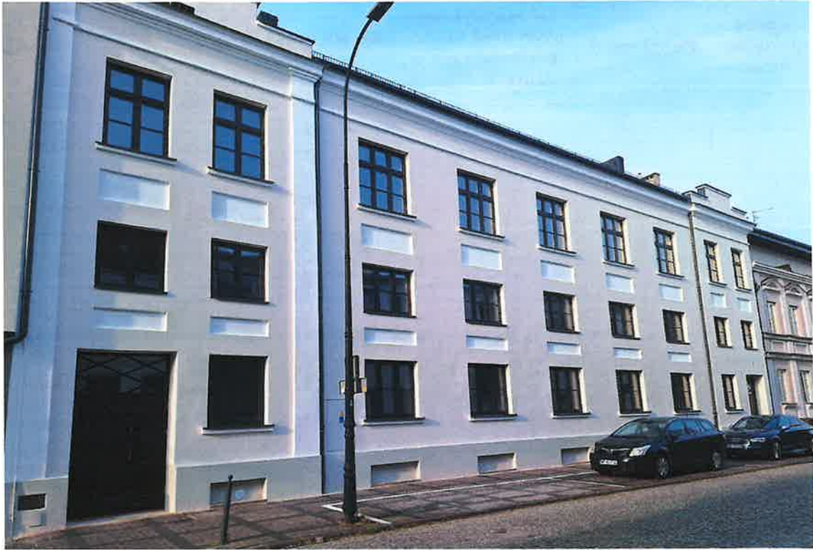
ul. Kazimierza Wielkiego 7