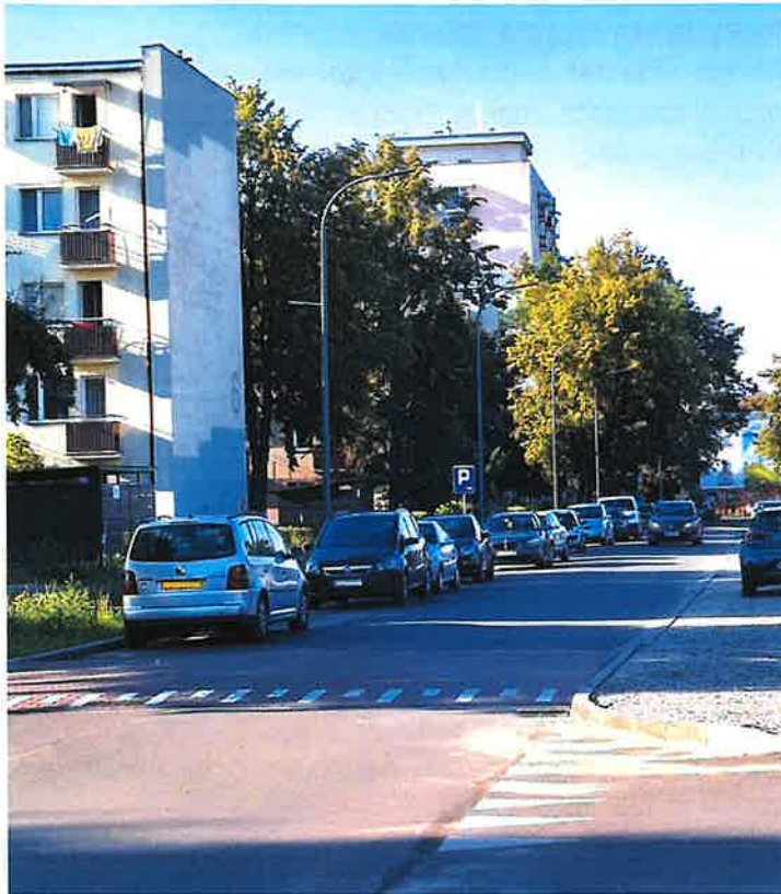
ul. Na Skarpie