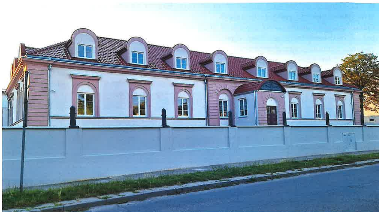
ul. Misjonarska 7