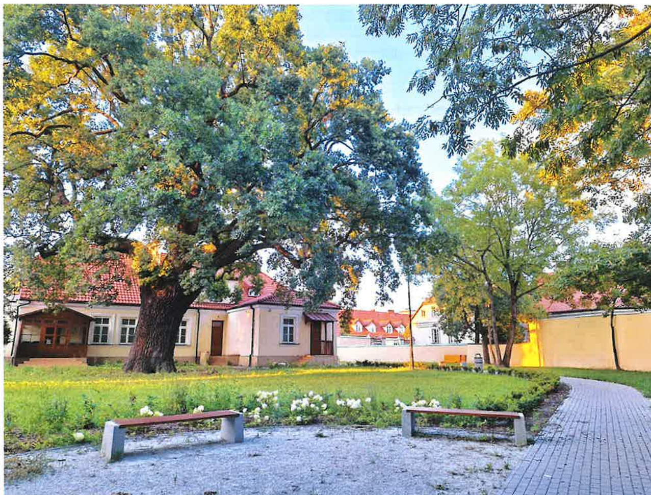
Teren za Domem Broniewskiego