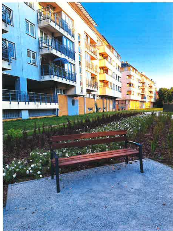
Park kieszonkowy przy ul. 3 Maja