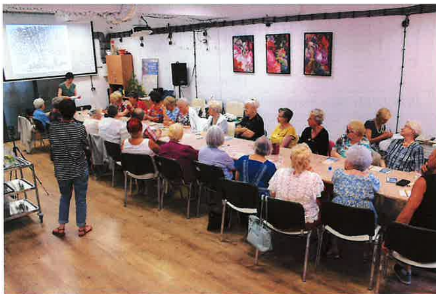
Achawa. Cykl warsztatów i spotkań z historią i kulturą płockich Żydów

Realizacja przedsięwzięcia A.1 kontynuowana jest w roku 2024. Zarządzeniem Nr 5018/2024 Prezydenta Miasta Płocka z dnia 8 marca 2024 roku przyznano organizacjom pozarządowym 4 dotacje w łącznej wysokości 130.000 zł na realizację przez nich przedsięwzięć rewitalizacyjnych. Dzięki dotacjom przyznanim w tym roku wielu Płocczan może uczestniczyć w wakacyjnych koncertach organizowanych przez Płocką Lokalną Organizację Turystyczną na Starym Rynku oraz w warsztatach, zajęciach i spotkaniach organizowanych przez Stowarzyszenie Człowiek Kultura oraz TEEN CHALLENGE Chrześcijańską Misję Społeczną. Przed świętami Bożego Narodzenia Fundacja REVITA zorganizuje konkurs na najpiękniejszą choinkę.