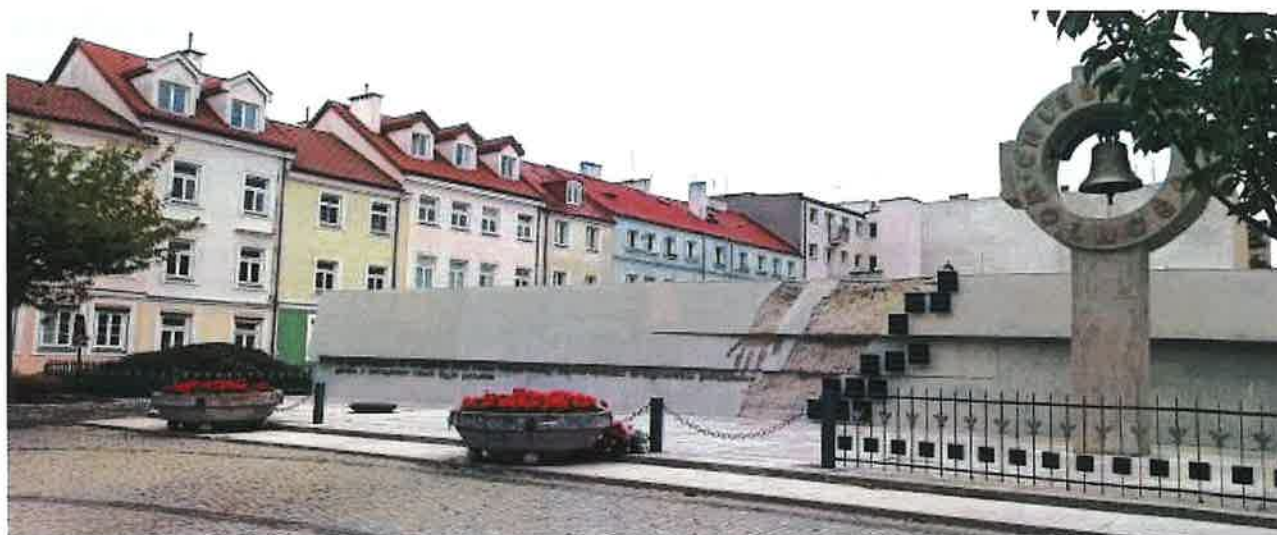
Pomnik 13 Straconych

W 2023 roku Straż Miejska w Płocku zamontowała 1 punkt kamerowy na al. Spacerowej.