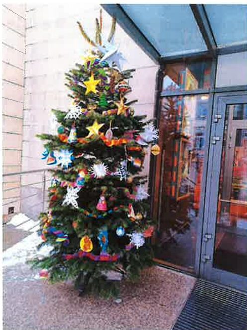
Najpiękniejsza Tumska choinka 2023

W ramach realizacji tego przedsięwzięcia w 2023 roku Fundacja Revita zrealizowała konkurs „Najpiękniejsza Tumska choinka 2023”. Konkurs ten polegał na dekorowaniu choinek ustawionych przed lokalami przedsiębiorców prowadzących działalność na pierwszym podobszarze rewitalizacji. Choinki dekorowały dzieci z płockich placówek szkolno – wychowawczych. W konkursie udział wzięło 37 przedsiębiorców oraz 38 grup dzieci. Przedsięwzięcie to zostało dofinansowane ze środków budżetu miasta Płocka, co wskazano w opisie przedsięwzięcia A.1.