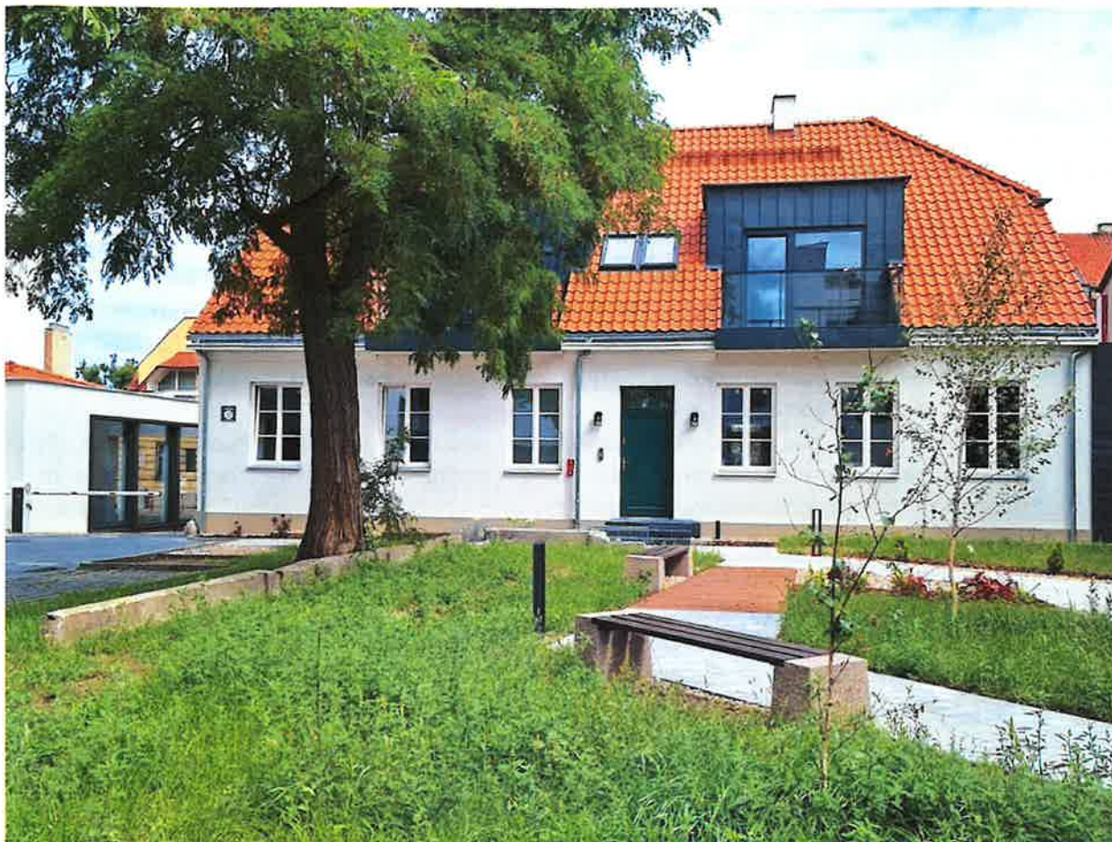
ul. Kolegialna 12

Wymiana stolarki drzwiowej zewnętrznej w budynku frontowym od strony podwórza oraz w budynku oficyny nr 1 zostały dofinansowane z Budżetu Miasta Płocka, co wskazano w opisie przedsięwzięcia A.12.