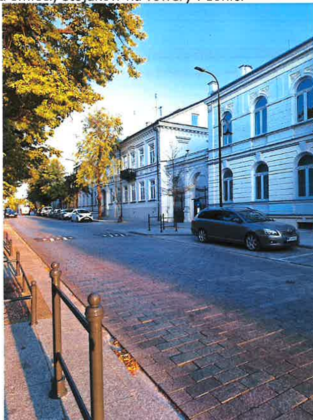
ul. Tadeusza Kościuszki

W 2023 roku kontynuowano realizację robót rozpoczętych w dniu 13 czerwca 2022 roku. Wykonano przebudowę jezdni na odcinku 485 m w zakresie jezdni z kostki granitowej, chodników z płyt granitowych oraz zjazdów z kostki granitowej. W obrębie drzew wykonana została specjalna mineralno-epoksydowa, przepuszczalna nawierzchnia (w kolorze szarego granitu). Zamontowane zostało nowe oświetlenie. Powstała zatoka autobusowa i 7 zatok parkingowych z 28 miejscami postojowymi. Wartość inwestycji wraz z waloryzacją: 10.896.637,94 zł. Realizacja przedmiotu zamówienia odbyła się z dofinansowaniem w kwocie 2.800.000 zł z Rządowego Funduszu Polski Ład: Program Inwestycji Strategicznych i 1.456.000 zł z budżetu Województwa Mazowieckiego w ramach „Instrumentu wsparcia zadań ważnych dla równomiernego rozwoju województwa mazowieckiego”. Remontowi ul. Kościuszki towarzyszył rozdział kanalizacji ogólnospławnej na sanitarną i deszczową. Wodociągi Płockie Sp. z o.o. w 2023 roku przebudowały kanalizację sanitarną DN400 (wraz z przyłączami) w skrzyżowaniu ul. Kościuszki i ul. Misjonarskiej, przebudowały kanalizację sanitarną DN200-300 (wraz z przyłączami) w obrębie pl. Dąbrowskiego, wybudowały wodociąg w ul. Kościuszki i pl. Dąbrowskiego DN225 dł. 759,38 mb z przebudową przyłączy DN40-110 dł. 305,76 mb. W roku bieżącym na ulicy Kościuszki trwa montaż elementów małej architektury w postaci ławek, koszy na śmieci, stojaków na rowery i donic.