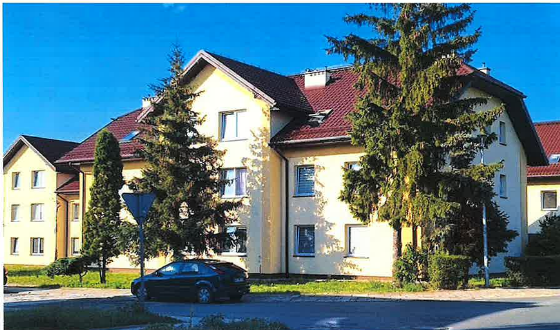
ul. Miodowa 27

W 2023 roku zakończono roboty budowlane związane z rozbiórką i budową nowego budynku mieszkalnego przy ul. Miodowej 27 z 15 mieszkaniami. Ich powierzchnia użytkowa waha się od 30,5 do 43 m 2 . Wszystkie lokale zostały wykończone pod klucz. Są wyposażone w drzwi wewnętrzne, grzejniki, armaturę i ceramikę łazienkową oraz kuchenną. Postawienie i wyposażenie bloku kosztowało ponad 2,56 mln zł.