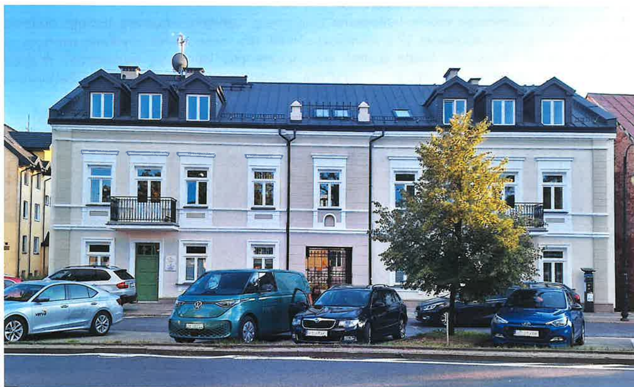
ul. Józefa Kwiatka 55

A.20. Aktywizacja społeczno-gospodarcza zmarginalizowanych śródmiejskich przestrzeni publicznych położonych na terenie pierwszego podobszaru rewitalizacji Realizacja przedsięwzięcia zakończyła się w 2019 roku.