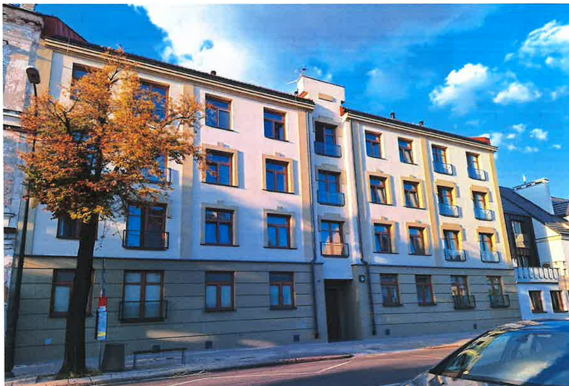
ul. Henryka Sienkiewicza 46

W 2023 roku zakończyła się realizacja przedsięwzięcia polegającego na rozbiórce oficyn położonych przy ul. Sienkiewicza 46 i 48 oraz budowie budynku mieszkalnego wielorodzinnego wraz z infrastrukturą techniczną przy ul. Sienkiewicza 46. W budynku przy ul. Sienkiewicza 46 powstało 21 lokali, z czego 20 przeznaczonych zostało do realizacji Programu „Mieszkania na start”. Lokale mają powierzchnię od 31 m 2 do 50 m 2 . Jeden lokal na parterze został przygotowany i przeznaczony na Rodzinny Dom Dziecka. Całkowity koszt przedsięwzięcia wyniósł 8.289.249,21 zł, natomiast wartość finansowego wsparcia z Banku Gospodarstwa Krajowego to ponad 7.818.448 zł.